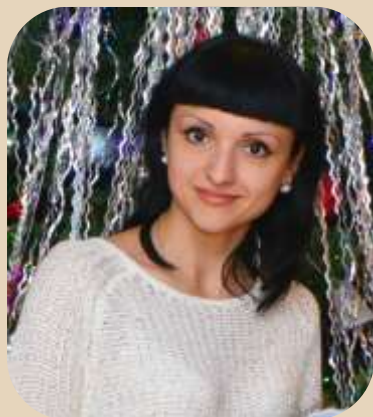
Педагог – организатор

Здравствуйтесь, дорогие читатели! Несмотря на минусовую погоду за окном, наступила горячая пора – второй семестр. Но наша работа не затихает, мы рады представить вашему вниманию очередной выпуск «Студенчество +», посвященный итогам первого месяца Нового 2016 года. Вы найдёте обзор мероприятий, проходивших непосредственно в техникуме и не только, мнения и рассказы студентов и преподавателей о проведенных каникулах, интервью с SUPER героем выпуска (новая рубрика) и полезную информацию, связанную со студенческой жизнью. Вначале нового семестра желаю студентам удачи, преподавателям терпения и чувства юмора! И улыбок... Улыбайтесь почаще, друзья, У-ЛЫ-БАЙ-ТЕСЬ!