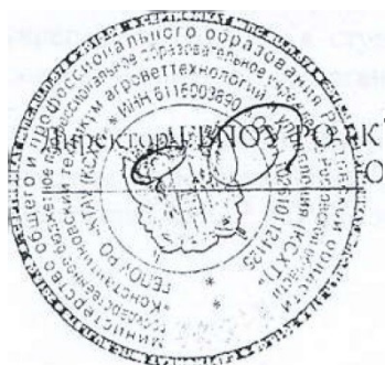
ГБПОУ РО «КТАУ (КСХТ)» И. О Григоренко

МБУЗ «ЦРБ Константиновского района Ростовской области 347250. г. Константиновск, ул. 25 Октября, 47 ИНН/КПП 61 16004157/61 1601001 Р/с 40701810560151000188 Отделение Ростов-на-Дону УФК по Ростовской области (ЦРБ л/с 20586Х34300) БИК 046015001